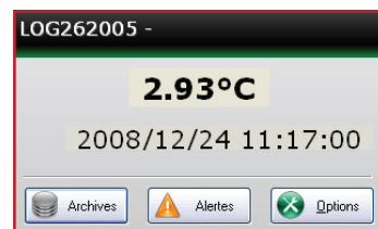
Visualizzazione temperatura su PC