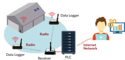
INTEGRATION UND SPS-Anschluss